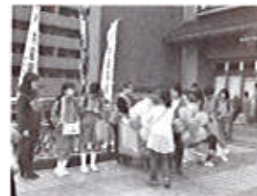
イベント募金の様子 わくわくフェスティバルで中学生ボランティアと

共同募金運動では、市内の小中学校、高等学校、民生児童委員、赤十字奉仕団、町内会、企業等地域の皆さまのご協力をいただきました。