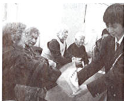
すき焼きのカード…何がでるかな?!