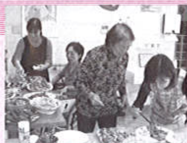
オリーブのクリスマスパーティーの様子 バイキングでお腹いっぱい大満足!