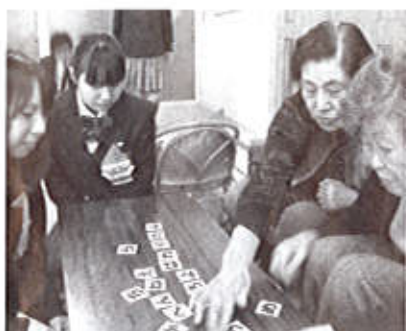
カードで言葉づくり。頭と指を使います

「にぎやかで楽しい」「ハンドベルなんてうまれて初めて触った」といった声が利用者からよせられました。最初はお互いに緊張気味でしたが、だんだんと時間が経つにつれコミュニケーションもとれ、皆さんの笑顔がいっぱいの楽しい時間となりました。