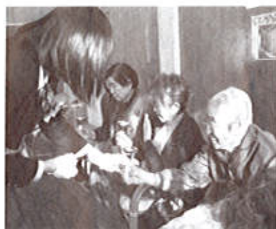
ハンドベル体験…皆さん楽しそうです

※「地域福祉（ちいきふくし）」とは 地域で「安心して暮らしたい」という誰もが持つ願いの実現です。実現の主体は住民のみなさん。行政・社協は一緒になって、地域福祉推進の取り組みを進めていきます。