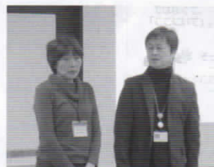
第1回「伝える編」の様子