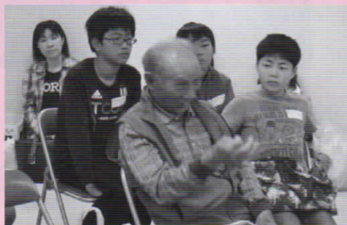
※子ども防災リーダーとは、高浜の防災を考える市民の会が主催する防災・減災に関する講座を学ぶ小中学生たちです。