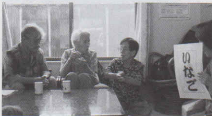
▲イナギッチョ。に沸く「あっぱ」（田戸町三丁目）