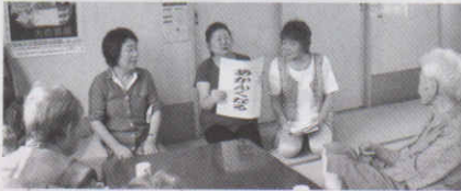
▲ボランティアの3人は、方言の書かれたカードを読み上げます。