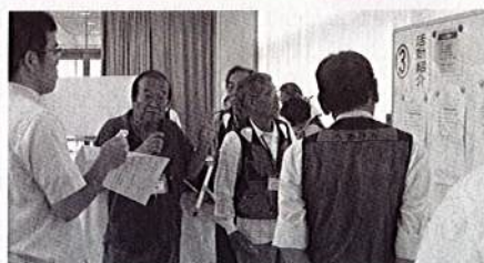
災害ボランティアセンター模擬訓練の様子