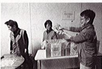
ボランティアの皆さん ありがとうございました!