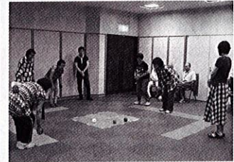
11/1 (日) のわくわくフェスティバルで体験コーナーを作ります。ぜひご参加下さい!